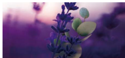
おやすみアロマ（ミッドナイトフローラルの香り）のイメージ