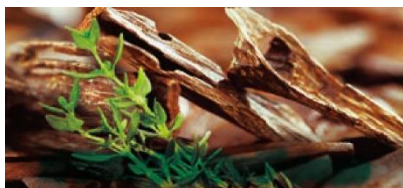
かつろぎアロマ（オリエンタルウッディの香り）のイメージ

「おやすみアロマ（ミッドナイトフローラルの香り）」は、花のみずみずしさを感じられるハーバルフローラル調の香りです。深く呼吸をするたび、リラックスできるような穏やかな印象に仕上がっています。オリジナルのブレンドオイル配合により、睡眠前によい香りをまとい、快適な睡眠環境を整えます。湯色はダスティブルー（にごり）です。どちらの入浴料も、香りはもちろん視覚的にもお楽しみいただけます。