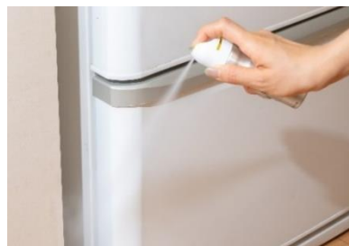
すき間への噴射イメージ