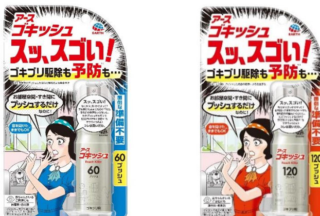
『ゴキツシュ スツ、スゴい！ 60プッシュ（左）／120プッシュ（右）』

アース製薬株式会社（本社：東京都千代田区、社長：川端克宜、以下「アース製薬」）は、効果と手軽さを追求し、窓を開けたまま ※1 でも使用できる 1 プッシュタイプのゴキブリ対策商品『ゴキツシュ スツ、スゴい！』を全国で発売しました。