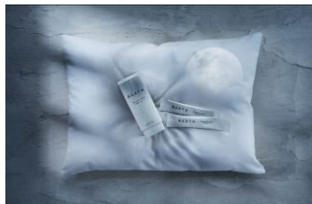
中性重炭酸洗顔パウダー