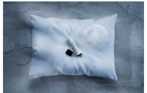
プレミアムリップクリーム