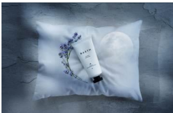
プレミアムハンドクリーム