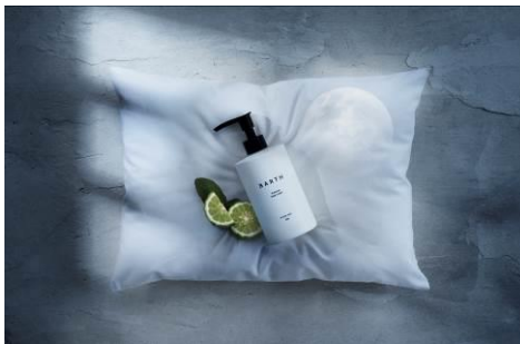
プレミアムボディクリーム at bath time