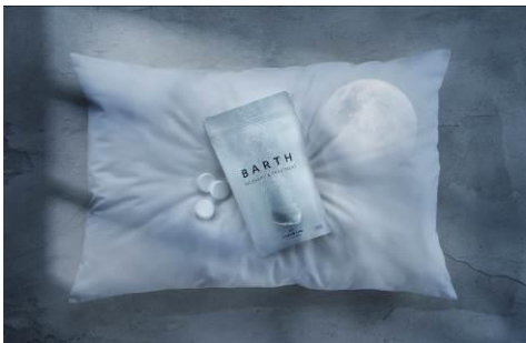
薬用BARTH中性重炭酸入浴剤

商品ビジュアルには、新たなブランドアイコンとして“枕”および枕にうっすらと浮かび上がる“月”をモチーフに取り入れました。窓から差し込むやさしい月明かりを窓枠の影を用いて表現し、ナイトタイムを彷彿させるビジュアルへとリニューアルしました。