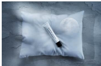
プレミアムアイクリーム