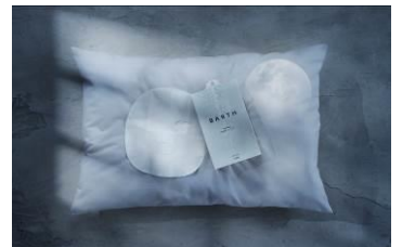
中性重炭酸フェイスマスク