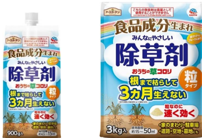
『アースガーデン おうちの草コロリ 粒タイプ』

アース製薬株式会社（本社：東京都千代田区、社長：川端克直、以下「アース製薬」）は1月20日（金）、園芸用品ブランド「アースガーデン」から、食品成分生まれの除草剤『おうちの草コロリ 粒タイプ』を全国で発売します。