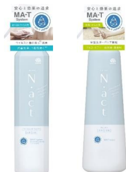
除菌・消臭スプレー（左）、肌用クリーンミスト

アース製薬株式会社（本社：東京都千代田区、社長：川端克宜、以下「アース製薬」）は、『N.act 除菌・消臭スプレー』『N.act 肌用クリーンミスト』など 3 製品を全国発売しています。『N.act』は、“新しい生活に寄り添う”をコンセプトに誕生した当社の新ブランドで、革新的な酸化制御技術「MA-T」※1を活用しています。