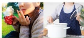
食事前の口周りや料理時の手指に