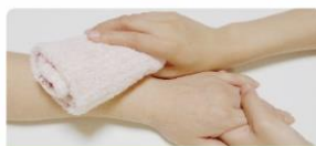
介護でのからだケアに