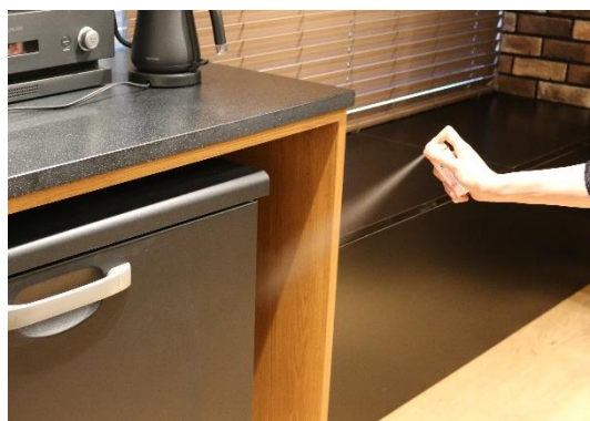
左『おすだけアースレッド 無煙プッシュ』、右：噴射イメージ