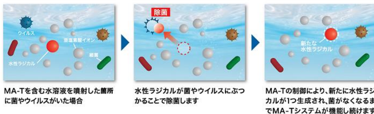
図1：MA-Tシステムメカニズムについて

『MA-Tシステム』は、要時生成型亜塩素酸イオン水溶液を発見した株式会社エースネットと、株式会社 dotAqua が共同開発し、大阪大学が分析・検証を行った除菌・消臭剤のシステムで、2015年に基本特許出願に至り、『MA-Tシステム』を採用する商品は多くの公共交通機関とそのトイレ、病院、ホテルでも利用されてきました。