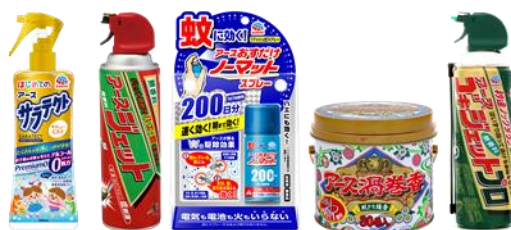
防除用医薬部外品