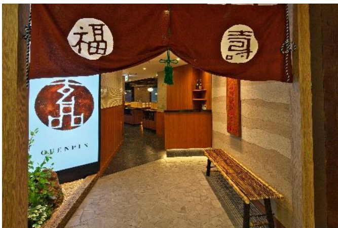
【とらふぐ料理専門店「玄品」店舗の様子】

今回パートナーシップを結んだ関門海が運営するとらふぐ料理専門店「玄品」では、独自の熟成技術で「旨味」を引き出しています。「とらふぐコラーゲン美容ジュレ」では、この「玄品」で提供されている、旨味を封じ込めたとらふぐから抽出したコラーゲンを使用。また、「玄品」が持つ独自のイオン化ミネラル処理技術も活用して、コラーゲンの体内への吸収効率を向上させています。