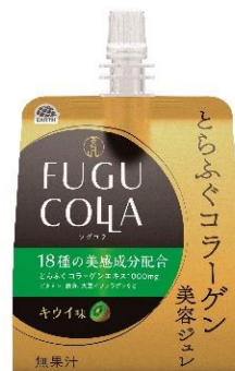
【とらふぐコラーゲン美容ジュレ】 ～キウイ味～

とらふぐは、ふぐの中でも高価なため、ふぐ料理店などでは「ふぐの王様」とも呼ばれています。ただ、近年資源量が減少しており、水産庁でも「トラフグ資源管理検討会議」を立ち上げ、対策を検討しているほど希少価値のある魚となっています。そのため、養殖技術の研究開発も盛んに行われています。