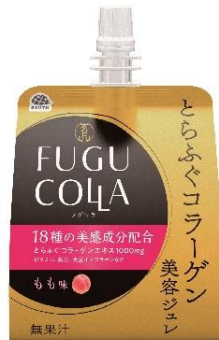
【とらふぐコラーゲン美容ジュレ】 ～もも味～

アース製薬株式会社（本社：東京都千代田区、社長：川端克宜、以下「アース製薬」）は、希少な高級魚とらふぐの良質なコラーゲンを原料とした「とらふぐコラーゲン美容ジュレ」（もも味、キウイ味の2種類）を、全国展開するドラッグストアで6月1日より限定発売いたします。