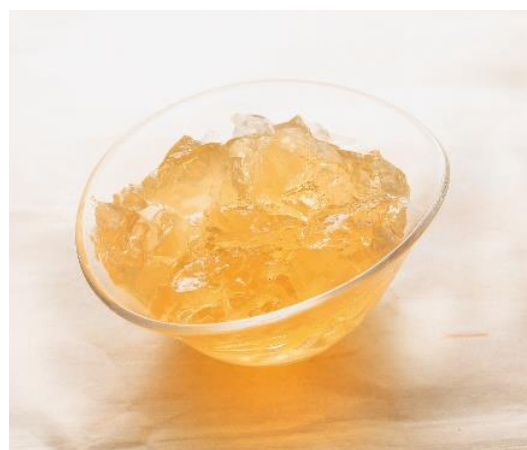
【抽出されたコラーゲン】