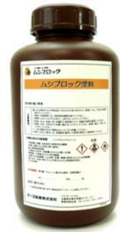
ムシブロック塗料 1Lボトル ※14kg缶入りもあります